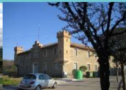
Jaciment i museu arqueològic de l'Esquerda