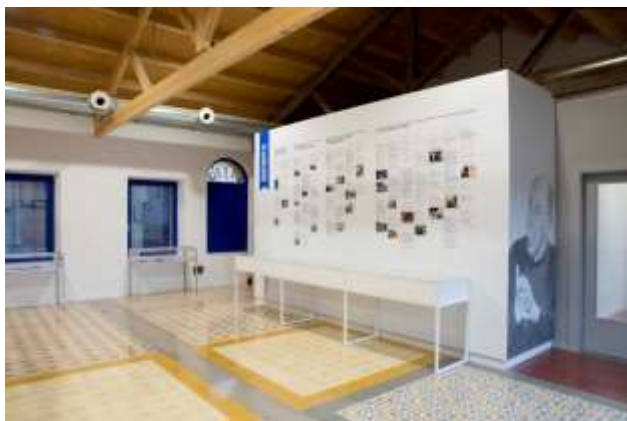
Fundació Miquel Martí i Pol

Al matí començarem amb una visita comentada al museu i al jaciment arqueològic de l'Esquerda continuarem amb un dinar en un dels restaurants del poble i acabarem a la tarda amb una visita comentada i guiada per l'exposició permanent i la seu de la Fundació Miquel Martí i Pol i recorregut fins a la fàbrica Tecla Sala amb explicació de la indústria i lectura de poemes.