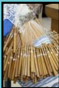
Visita a l'escola de puntaires