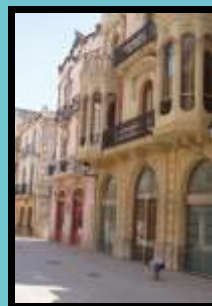
Visita guiada al nucli antic