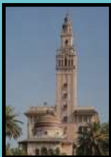
Visita guiada a la Giralda de l'Arboç

Una vivència única i inoblidable. Descobriu l'essència de L'Arboç a través dels seus atractius i els seus productes