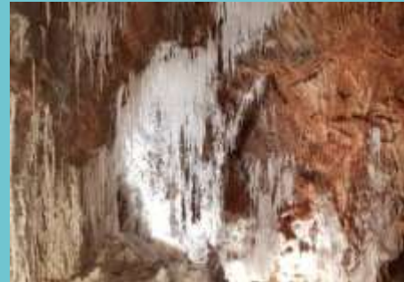
Interior de la Muntanya de Sal

L'explotació de la sal i la Vall Salina constitueixen la raó de ser de Cardona i la causa de l'esplendor del seu passat. La seva carta de poblament, que data de l'any 986 i és una de les més antigues d'Europa, recollia el dret dels vilatans a obtenir sal per sempre més. La Muntanya de Sal és un fenomen natural únic al món. Els seus 120 metres són només la punta d'un enorme diapir de prop de dos quilòmetres de profunditat. Durant anys, aquesta esdevingué una de les mines de sal potàssica més importants del món, Mina Neus de Cardona (1929-1990). Avui, el vell recinte miner és el Parc Cultural de la Muntanya de Sal, un gran equipament cultural que pretén divulgar la importància de la sal, l'excepcionalitat geològica del jaciment i l'aprofitament que l'home ha fet d'aquest recurs natural durant segles.