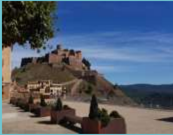
Mirador de la Fira

Vila ducal situada al Bages, gairebé al centre de Catalunya.