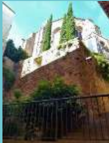
Església de St. Miquel