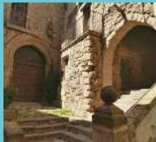
Plaça de Sta. Eulàlia