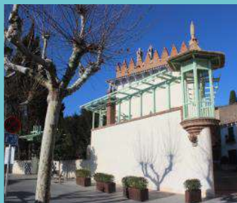
Casa Puig i Cadafalch