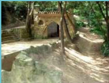
Font del Ferro